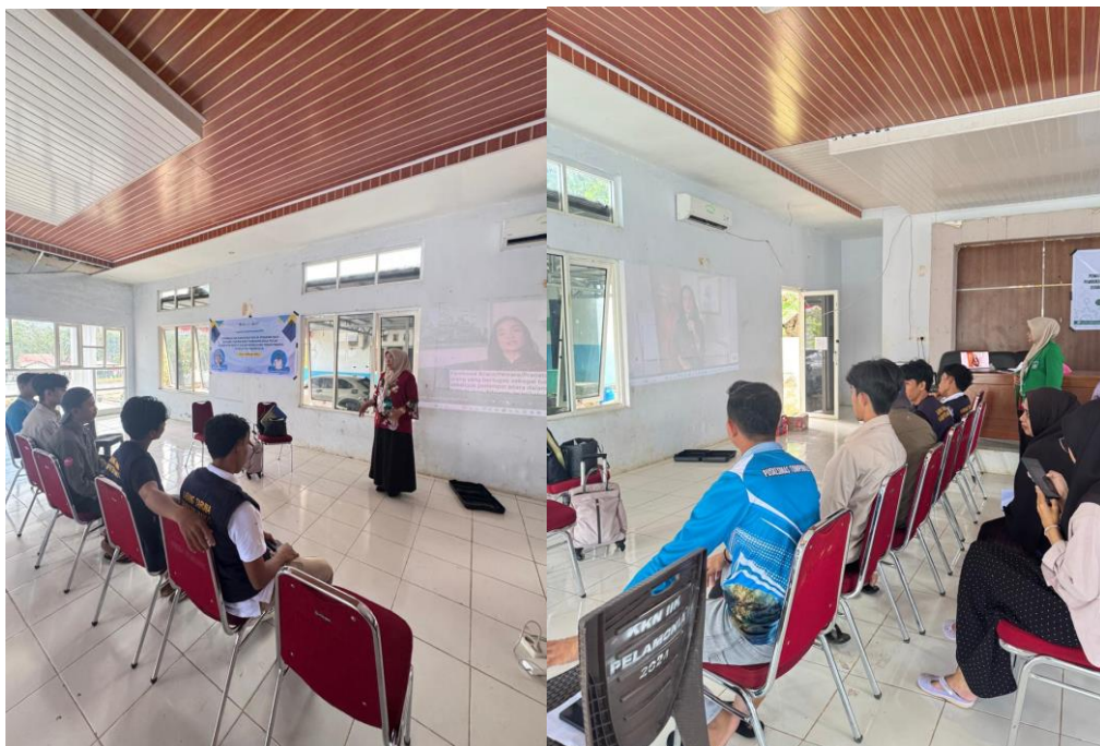
Gambar Foto 7 Saat Menyampaikan Materi Public Speaking