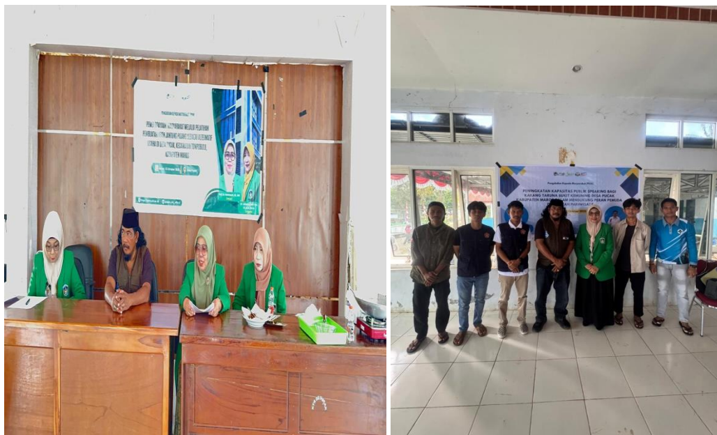
Gambar Foto 1 dan 2 Pelatihan di buka oleh Bapak Kepala Desa Pucak, Kabupaten Maros