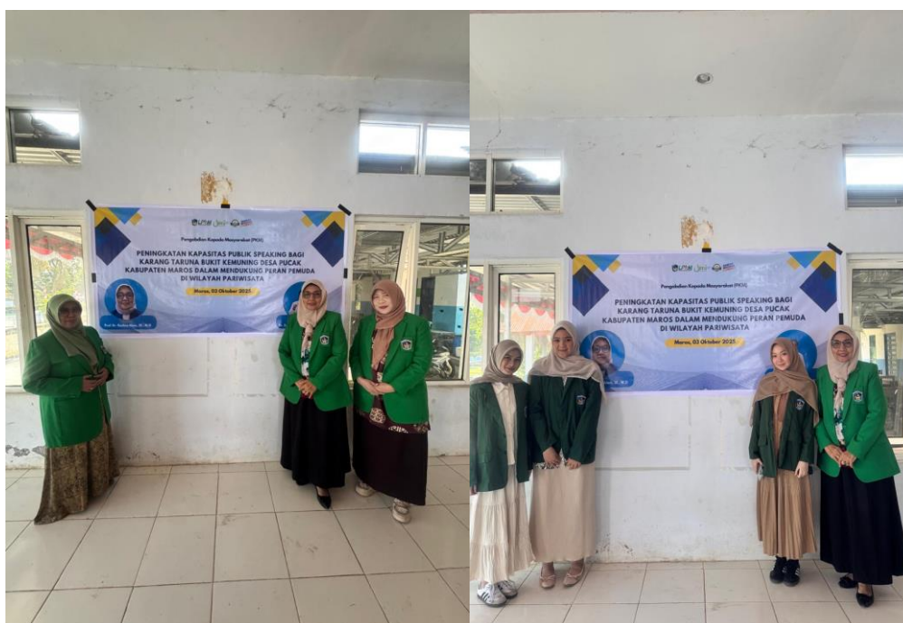
Gambar Foto 3 dan 4 Pelaksana PKM UMI